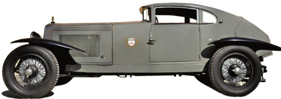
ITALA TIPO 61 Coupé Spéciale 1928

Se denomina comprador o adjudicatario al mejor postor , el cual acepta las condiciones de venta, inscritas en el catálogo y adquiere el objeto al precio de adjudicación que anuncia el subastador en el momento del golpe del martillo.